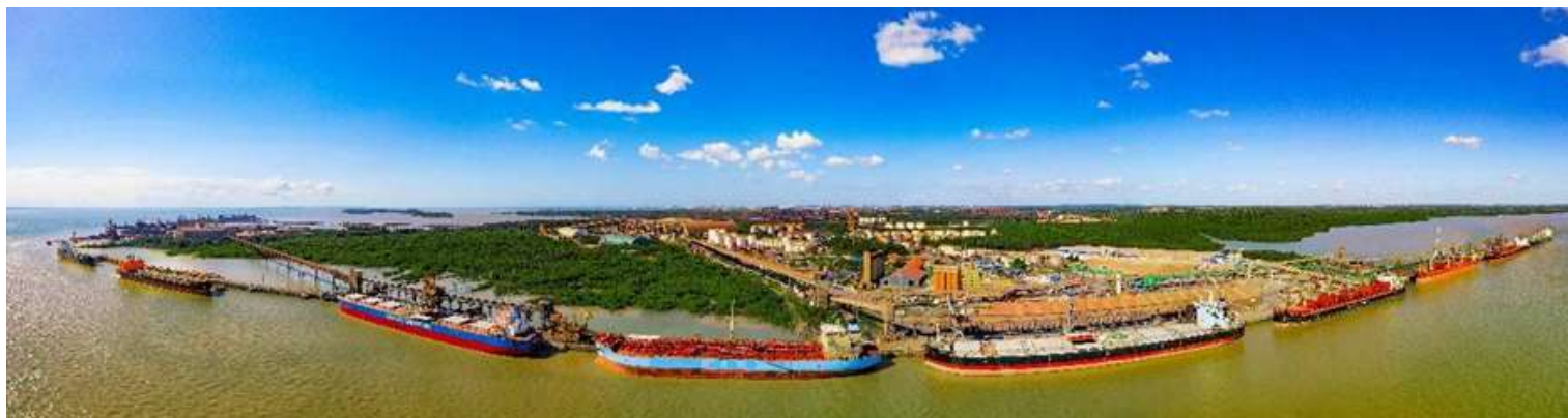
Porto do Itaqui, patrimônio do Maranhão e do Brasil

Conectado ao restante do país por modernas ferrovias e rodovias, o Itaqui destaca-se como o principal porto do Corredor Centro-Norte do país, um trabalho reconhecido com nota máxima no IGAP - Índice da Gestão das Autoridades Portuárias, categoria do Prêmio Portos + Brasil 2022, do Ministério de Infraestrutura.